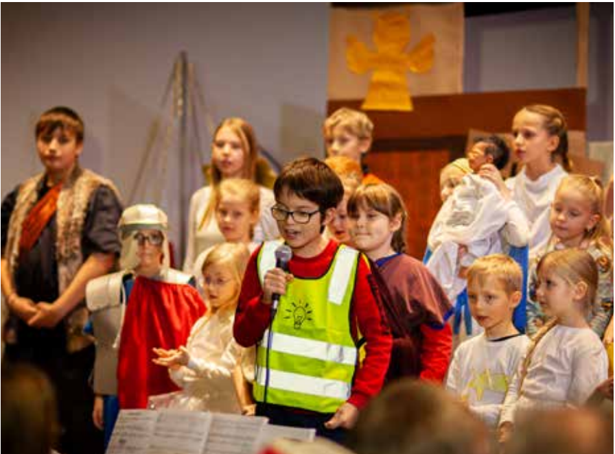
Das erste Kindermusical in der Pauluskirche. Text auf Seite 16.